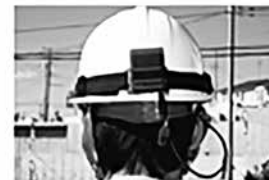
ヘルセンサー(受光器)