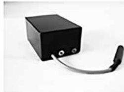
コントローラ (電波受信機)