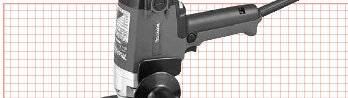
ディスクサンダー GV7000C