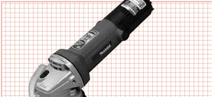
コンクリートカンナ