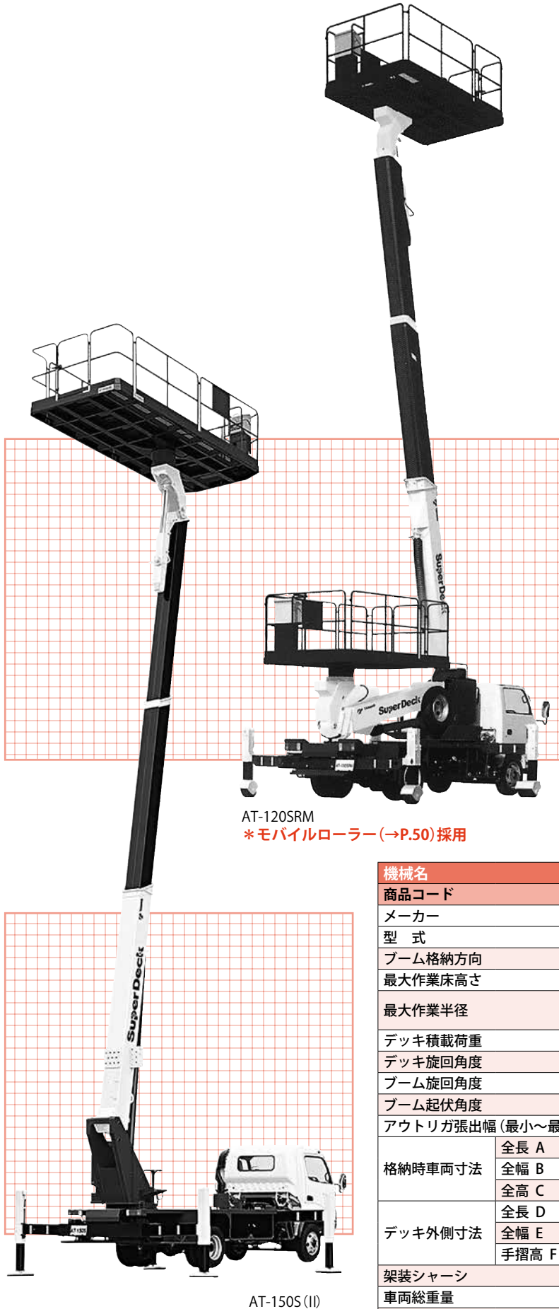
AT-120SRM *モバイルローラー(→P.50)採用