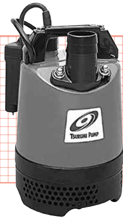
自動運転型 (2インチ)