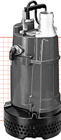
自動運転型 (3インチ/4インチ)